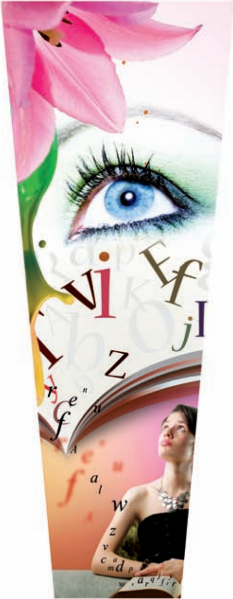
printing for emotions