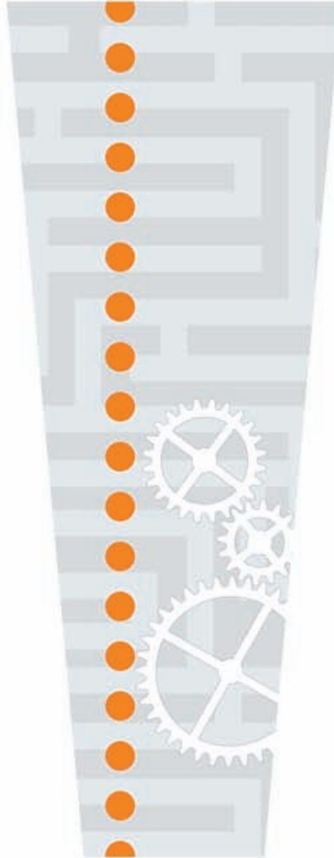
printing for production